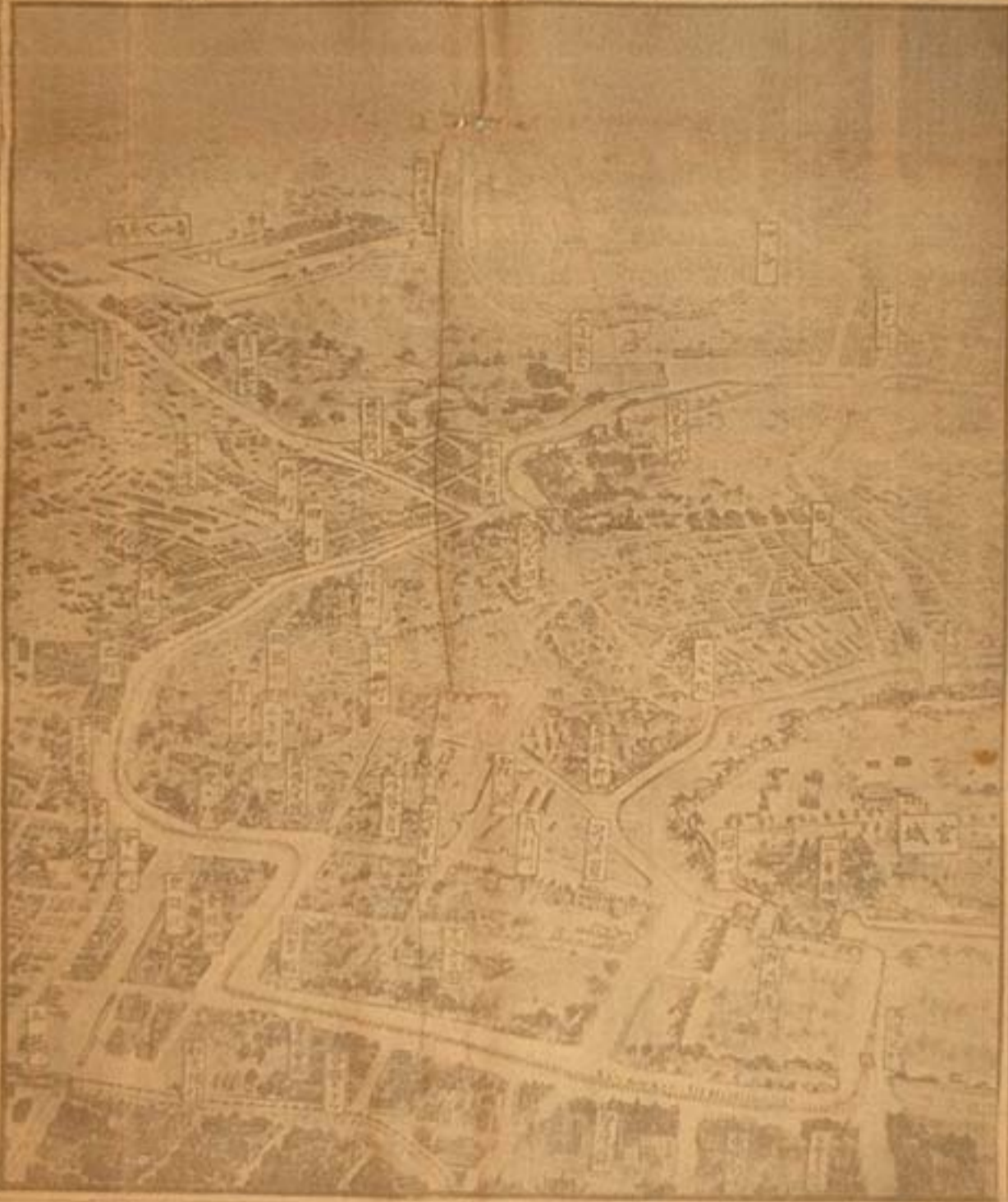
御大葬御道筋鳥瞰圖