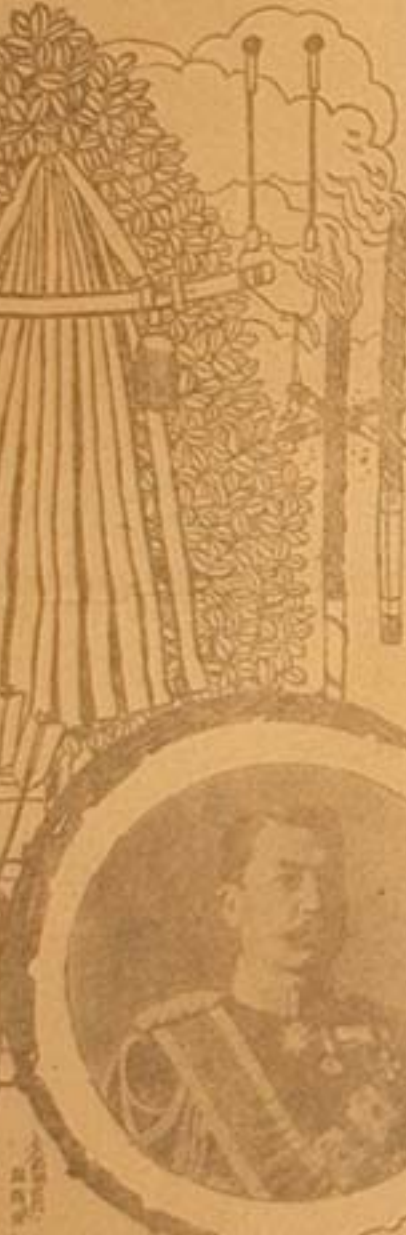
皇太后崩御の詠辭

皇太后崩御の詠辭は、詠、よみ、まはり、と、言、ふ、は、り、に、 皇太后崩御の詠辭は、詠、よみ、まはり、と、言、ふ、は、り、に、 皇太后崩御の詠辭は、詠、よみ、まはり、と、言、ふ、は、り、に、