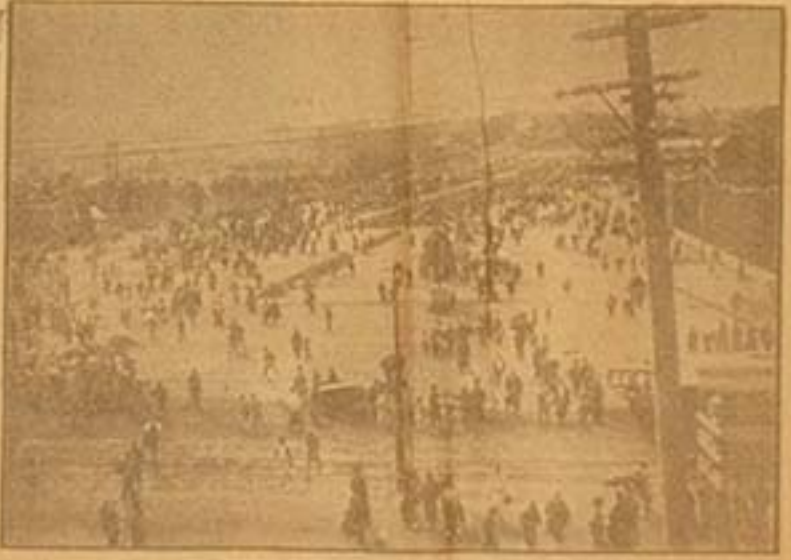
御大祭前日の二重橋