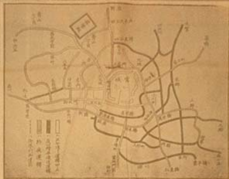
本日電車運転中止區域の圖