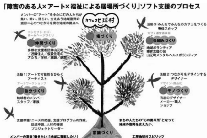
図1 「カフェ地球村」のソフト支援の基本的展開プロセス

「カフェ地球村」のソフト支援の基本的展開プロセスとしては、「意識づくり(メンバーの意欲「働きたい」「地域に貢献したい」)⇒自分づくり⇒モノづくり⇒仕組みづくり⇒仲間づくり⇒(そのための)場づくり」(図1)という樹木が茂る様子としてイメージされている。