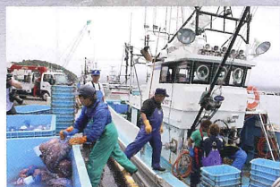
▲タコ水揚げの様子

そこで私たちは広く寄付を募り、漁師さんの負担を減らすため、タコ漁にかかるエサ代として、皆様からお預かりする寄付金を届けることにしました。