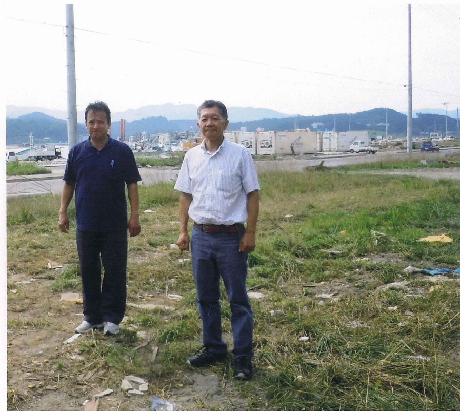
写真は、伊藤(株)、マルセン食品、(株)ヤマウチ、(株)及善商店ら、地元の5社が共同で工場を建設する予定地