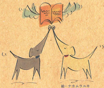
絵・ナカムラユキ