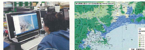
4月4日 最初の被災地入り 石巻市へ