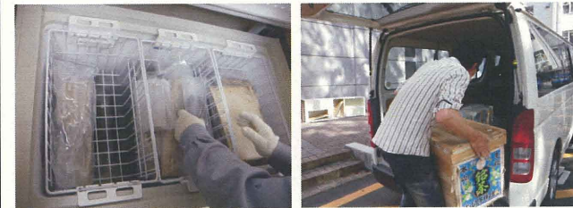
東北大学史料館での凍結処理(一部) 5月13日 奈良市場冷蔵(大和郡山市)へ向け発送