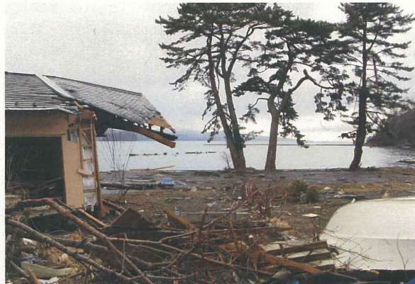
名振・N家土蔵(2011年4月4日)