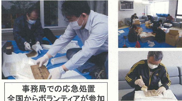
事務局での応急処置 全国からボランティアが参加