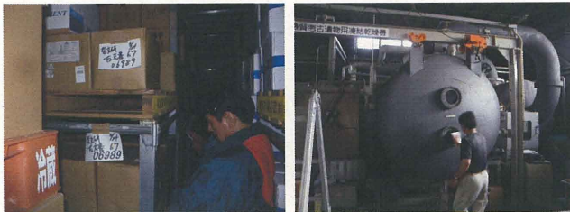
奈良市場冷蔵での冷凍保管 奈良文化財研究所での乾燥処理