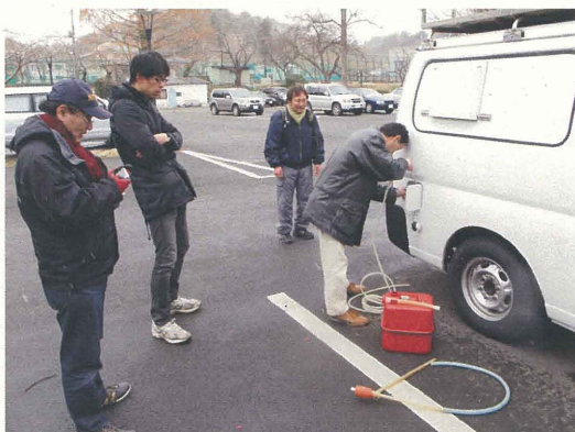
ガソリンの枯渇 被災地への視察ができず