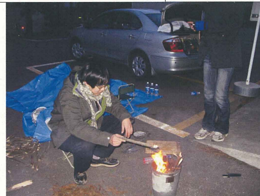
事務局員も被災者に 一時は車中泊をして過ごす