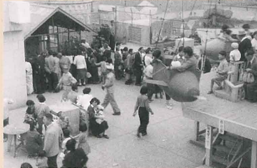
藤崎屋上 (昭和28年頃)

懐かしい仙台を映した写真や8ミリ映像を収集・保存しています。仙台の町並みはもちろんのこと、子どもの成長記録や生活の様子など、懐かしい昭和の仙台を収集し、次世代に残す「宝物」としてデジタル保存をしております。