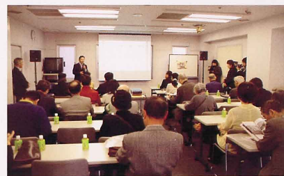
仙台市市民活動サポートセンター(2010年4月)

NPO法人20世紀アーカイブ仙台の活動に賛同し、年会費(5,000円)をお支払いいただくと、新たに収集した昭和時代の写真などを掲載した会報「クラシカルセンダイ」(2011春より年2回発行)を郵送でお届けします。また、当NPO主催映像・写真展示の割引ご招待などもプレゼント予定です(個人・団体・企業で会員登録が可能です)。