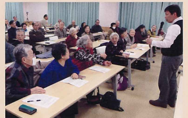
北山市民センター (2011年1月)