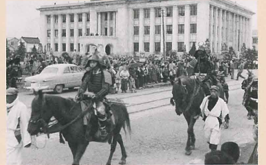
青葉まつり (昭和31年)