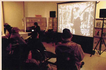
仙台市歴史民俗資料館 (2010年1月)

懐かしい映像と音楽を交えながらお楽しみいただく上映会を実施しています。プロではない市民が撮影した昭和30年代～40年代の8ミリ映像は、生活に密着した「より身近な」懐かしい仙台の映像です。