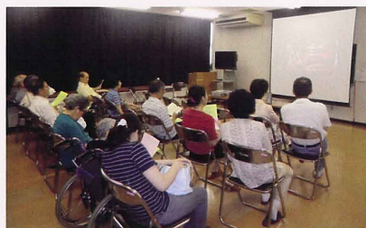
生出市民センター(2010年8月)

回想法レクリエーション「出前本舗」をご要望に合わせて各施設で実施するための、サポートスタッフを募集しております。専門のトレーニングプログラム(受講、実習各1日10,000円)を受けていただいた後、回想法レクリエーションを行うためのNPO法人20世紀アーカイブ仙台「ボランティアスタッフ」として活動していただけます。