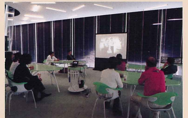
せんだいメディアテーク (2010年9月)