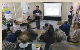
仮設住宅で「昭和の仙台を語る会」