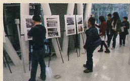
せんだいメディアテークで写真展