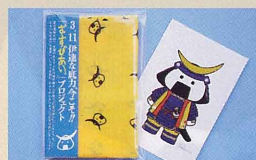
むすびあいバンドナ制作