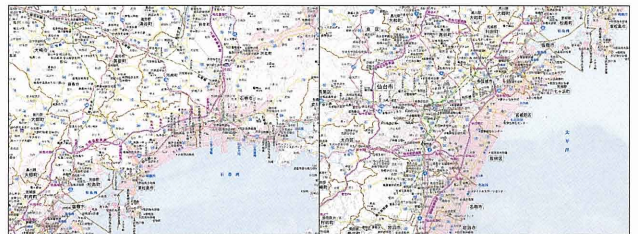
津波浸水被害がわかるエリアマップ