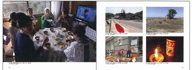
市民が撮った震災写真。生活ぶりがわかる身近なものが満載

2011年3月11日午後2時46分に発生した東日本大震災。この震災を風化させることなく、「市民が記録した写真を後世に残す」ことを目的に、わたしたちは、3月22日からインターネット上で画像提供を呼びかけました。これらの写真は、全てわたしたち市民が地震被害の様子や、震災の中の生活ぶりを撮影したものです。撮影者が【映し残さなければ】という思いで撮影されたこれらの画像は、報道写真とは異なる目線で撮られた「ありのまま」の姿を伝えます。書籍化することでより多くの方々にご覧いただき、100年後も1000年後も、「記憶遺産」として3.11を後世に語り伝えていきます。