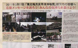
鹿兒島からのメッセージ