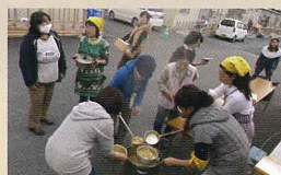
仮設住宅で映画上映会&芋煮会