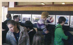
イタリア ミラノでも写真展開催