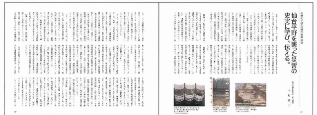
過去に宮城を襲った地震津波の歴史を史実に基づき説明