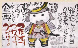
東京の絵手紙サークルの皆さん