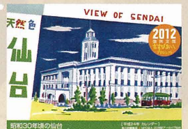
2012年カレンダー制作