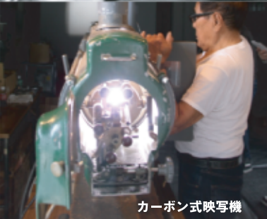
カーボン式映写機