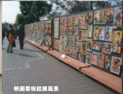
映画看板絵展風景