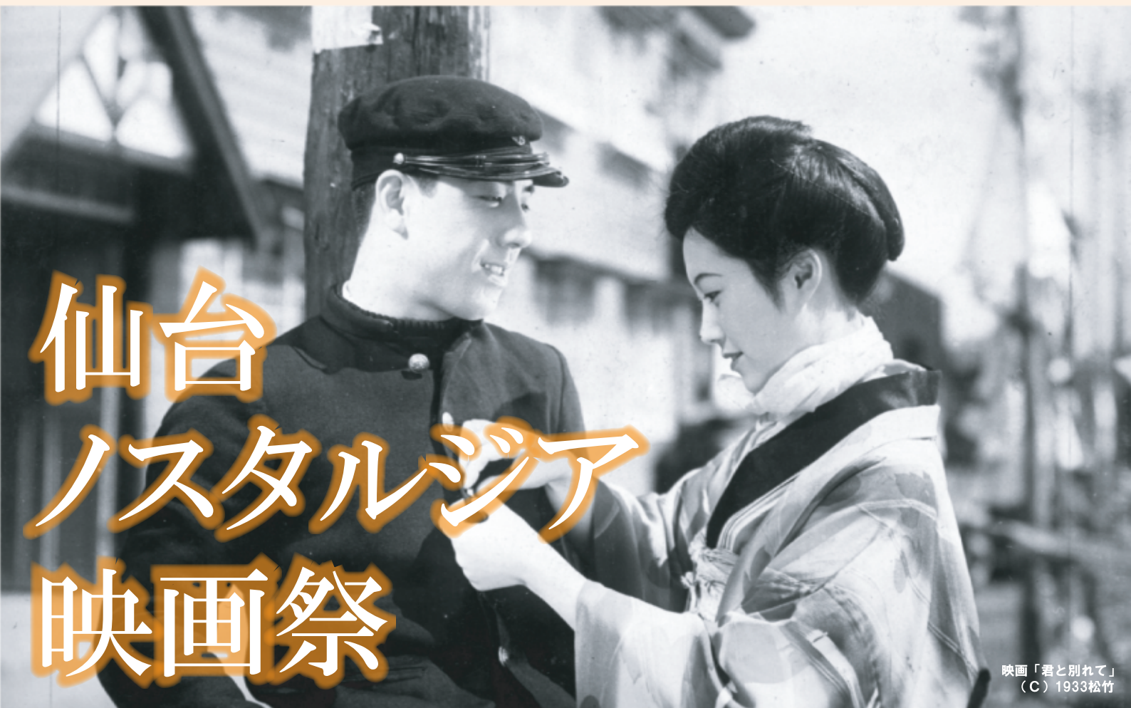
映画「君と別れて」 (C) 1933松竹