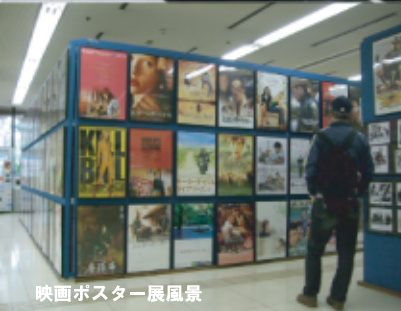
映画ポスター展風景