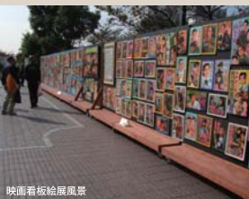
映画看板絵展風景