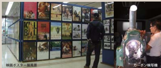
映画ポスター展風景