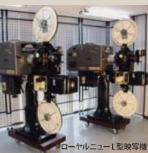
ローヤルニューL型映写機