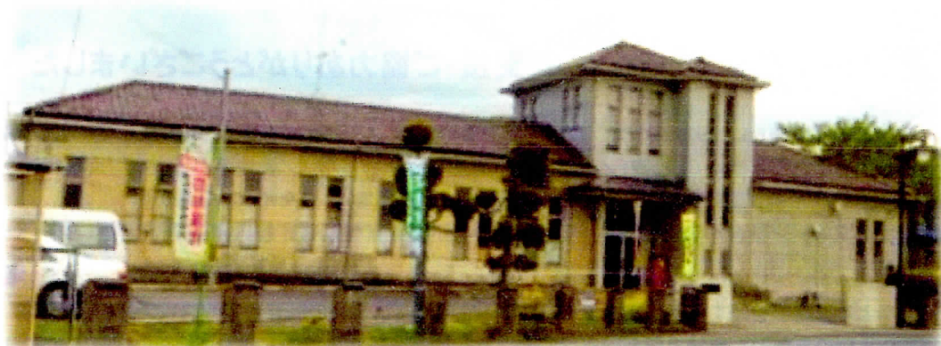
震災前の南三陸町図書館