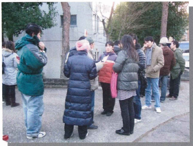
《避難所や留学生宿舎を巡回して情報提供》