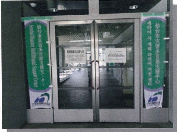
《国際センター入口に多言語支援センターの旗を設置》