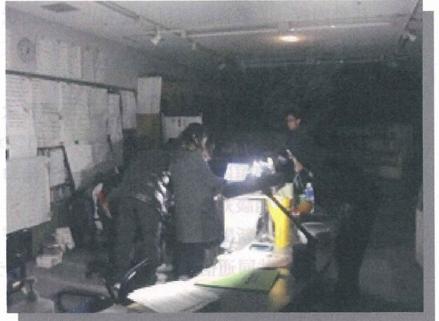
《センター開設2日目の夜 電気不通の中で電話対応》