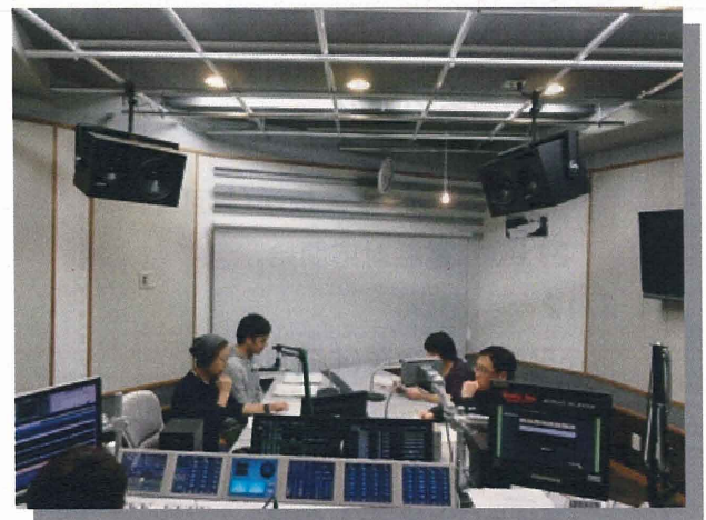
《FMラジオ局での多言語情報の収録》