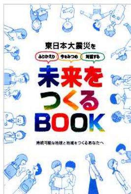
〇たがさぽで閲覧・貸出ができます。