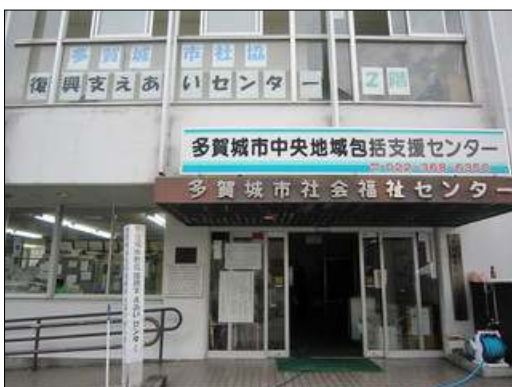
多くの支援をマッチングしてきた支えあいセンター

所在地・連絡先等に関しては、今夏に移転を予定しています。詳しくは「復興支えあいセンター」HPでご確認ください。新しい連絡先等については、たがさぼブログ等でもお伝えします。