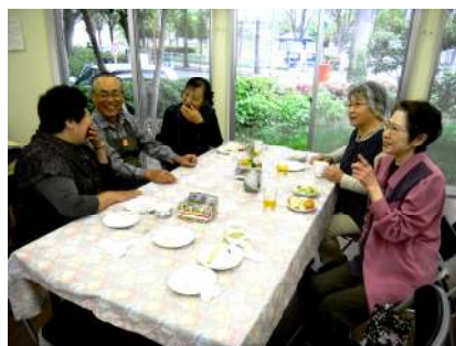
談笑する参加者のみなさん

つながりをつくろうと行事を企画するけれど、なかなか人が集まらないという役員の方の悩みもあると思います。地区ごとの課題や背景はさまざまですが、安心して暮らすために地域交流が必要であることは共通しています。新たな地域づくりのヒントとして、参考にしてみたいはいかがでしょうか。