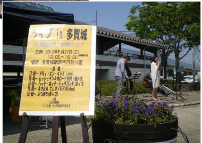
写真：ライブに出演するミュージシャン

5月27日(日)、晴天の空の下、多賀城駅前にて「ライブ in 多賀城」が開催されました。企画したのは多賀城駅前ににぎわいをもたらす取り組みを行っている「T.A.P多賀城」と「ライブを聴こうin多賀城実行委員会」です。これまで音楽の力で駅前を盛り上げていました。去年は震災の影響で開催が見送られましたが、今回は2年ぶりの復活となりました。出演するのは県内各地で活躍するミュージシャンたち。自分たちの愛する音楽をお客さんに届け、多賀城に以前のようににぎわいをもたらしてくれました。