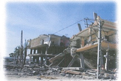
ミサイル攻撃を受けたパレスチナ ガザ地区の建物 2009年1月