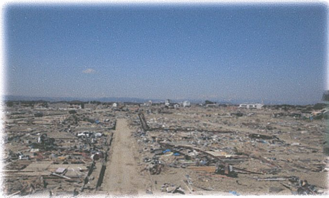
津波被害の街 東日本大震災