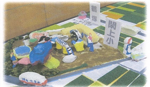
子どもたちの作ったジオラマ

●入場 無料 (5月1日より 受付開始、整理券をお送りします。定員になりしだい締め切ります)