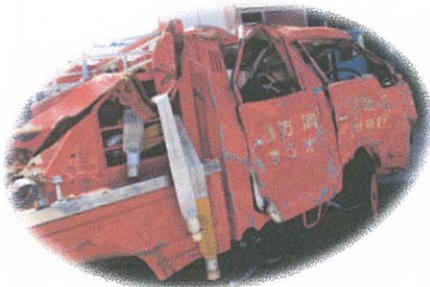
多くの人々を救った消防車 だったが・・・