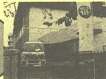
開催時に掲げるのぼり旗