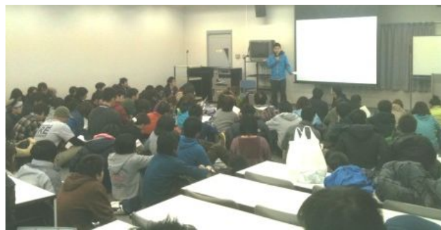
▲つなプロのボランティア説明会の様子

この調査結果を基に、これから専門性を有するNPOが支援を必要とする人たちの元へ派遣されていきます。避難生活が長引く事も視野に入れ、地元だからできる長期的なサポートを行っていく準備も、着々と進められています。