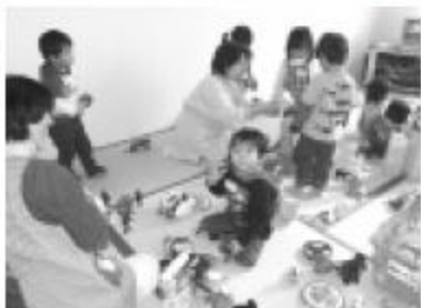
託児もあってほっと安心。(準備がない場合は同席でどうぞ)