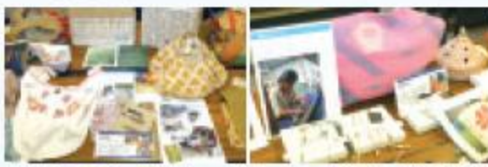
手紡ぎのカーディガンやショール、オーガニック食品などがいっぱい