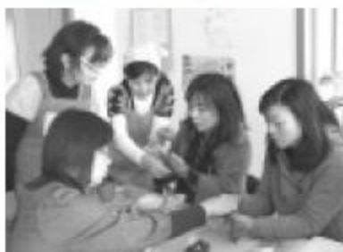
店舗集会所だけでなく、仮設住宅や地域の集会所でもわいわい楽しく