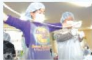
白い板状のガムのもとを粘土感覚で楽しくコネコネ、楽しいね!

小学生以上の子どもに保護者約20名が丁寧に教えていただきながら、それぞれオリジナルの風船ガムを作りあげました。ボトルに入れ、ラベルを貼って世界にひとつだけのオリジナルの風船ガムです。何もかも忘れ、夢中になったひととき。とても有意義な活動をありがとうございました。帰りには、のど飴やガムなどのお土産もいただきました。これからもたくさん地域の明るい笑顔を届けてください。