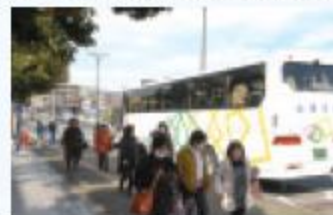
あれから1年、みなさんいろいろな思いで駆けつけました