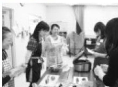
試食品もみんなで作ったりもします