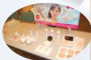
新商品は清潔感のある花柄が目印

コープ化粧品が誕生して35周年。メイクアップシリーズが3月にリニューアルされましたが、その発表に先立ち、3月7日、アエル5階多目的ホールで「コープ化粧品学習会&新商品発表会」が開催されました。会場はシンプル、カジュアル、シック、キュート、クール、フレッシュの6ブースに分かれ、200人近い参加で満席。全国の生協組合員の声を反映し、食品同様の安全安心な商品によるいつもと違うメイク術を学び、一足はやくメイクシリーズを体験しました。ラストはメンバーから選ばれた6人のモデルさんが会場を笑顔で巡るなど、楽しいひとときでした。みなさんぜひ、肌もいりで自然な仕上がりをお試しください。