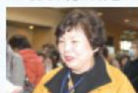
「あの日、同じ体験をし共に震災を乗り越えたという気持ちから、震災後にファンになったメンバーもたくさんいるんですよ」と大和理事