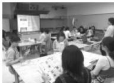
ふ～ん、なるほどがたくさんあった学習で女子力アップ