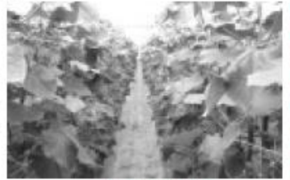
きゅうりのハウス

できませんでした。有機質肥料を入れ、除塩(畑のカルシウム施用)し土壌を改良しました。そして、7月にきゅうりの種まきを行い、9月から出荷できるようになりました。