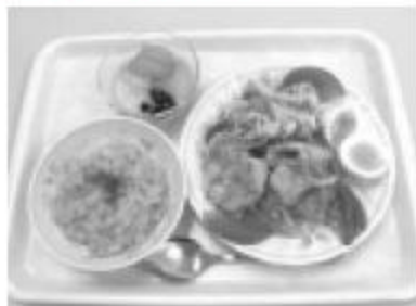
当日何がでるかはおたのしみ(イメージです)