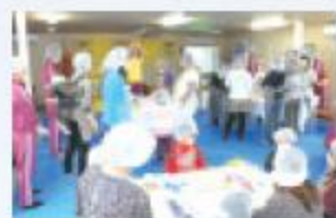
受付で、体調確認をして、手洗いの上、手袋やマスク姿に!

風船ガムで被災地の子どもたちに笑顔を届けよう!をテーマに、3月31日、日本クラフトフーズ(株)様の被災地支援が行われ、みやぎ生協石巻大橋店近くの仮設住宅集会所で「親子で手作りガム教室」が開催されました。