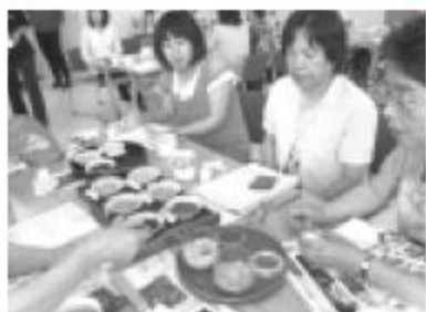
お取引様のご協力で(ごまの食べくらべ)