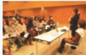
6ブースに分かれてのメイク学習