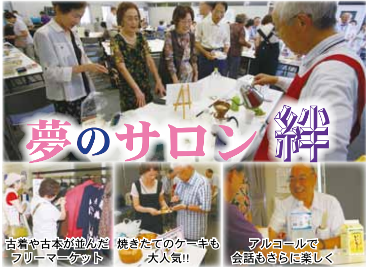
古着や古本が並んだ フリママーケット 焼きたてのケーキも 大人気!! アルコールで 会話もさらに楽しく