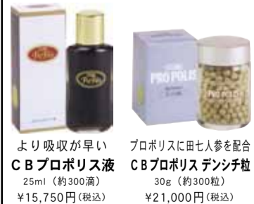
より吸収が早い CBプロポリス液 25ml (約300滴) ¥15,750円(税込) プロポリスに田七人参を配合 CBプロポリスデンシチ粒 30g (約300粒) ¥21,000円(税込)