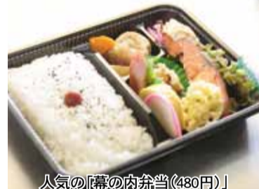
人気の「鶏の肉弁当(480円)」

国道286号線沿いにオープンした宅配がメインの弁当店「わくわく弁当」は通常2個以上の注文から配達してくれるところを、高齢の一人暮らしの方に限って弁当を1個から宅配して喜ばれています。