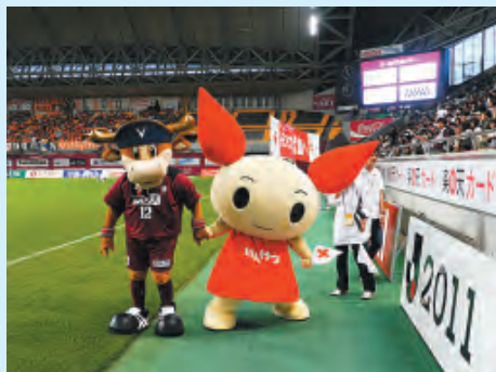
モーヴィと一緒に献血を呼びかけるけんけつちゃん