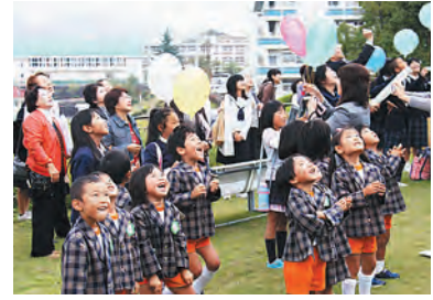
どこまで飛ばかな? どんな人が拾うだろう——思いもふくらみます