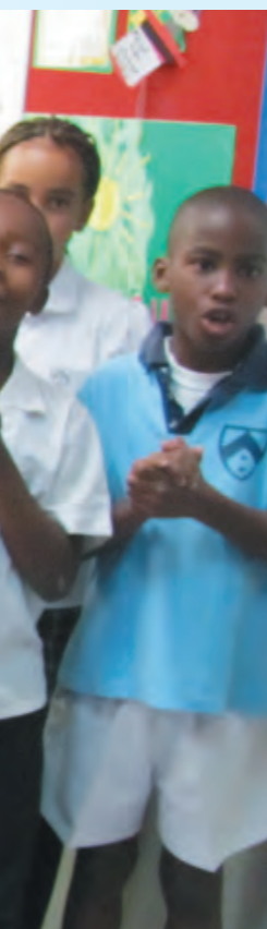
ナイロビのインターナショナルスクールの児童。日本文化や東日本大震災について勉強中で、「自分のお小遣いから寄付しました」という児童も。ITU KO PAMOJA はスワヒリ語で「私たちは一つです」。

は「IHOP」(Integrated Health Outreach Project) 地域保健強化事業(通称「愛ホップ」)に平成19年11月から取り組んでいます。この事業の財源は海外たすけあいが支えています。