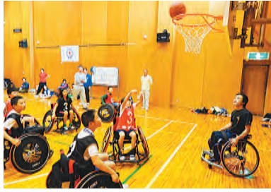
少年漫画にも取り上げられ注目を集める車いすバスケット