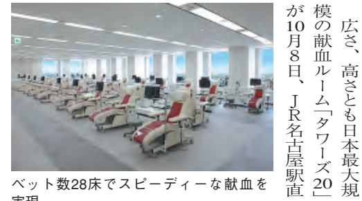
ベット数28床でスピーディーな献血を実現

広さ、高さとも日本最大規模の献血ルーム「タワーズ20」が10月8日、JR名古屋駅直結のJRセントラルタワーズ20階にオープンしました。フロア面積は約952平方メートルと日本一。明るく開放的な休憩室や採血室から眺む地上100メートルからの絶景が楽しめるほか、献血者向けにVOD(映像配信サービス)やWiFi-Fi(インターネット接続サービス)の環境も用意されています。オープン初日は午後からの