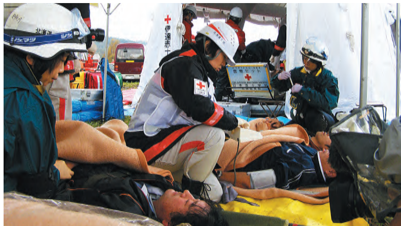
他の病院のDMATと共同で救護訓練にあたる日赤救護班