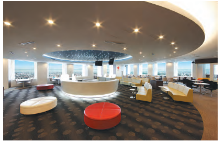
SF空間をイメージさせる広々とした待合室