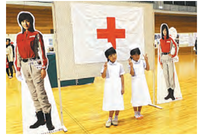
子ども用赤十字救護服や看護実習衣の試着コーナーも大盛況