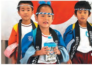
集めた1円玉募金を手に活動発表