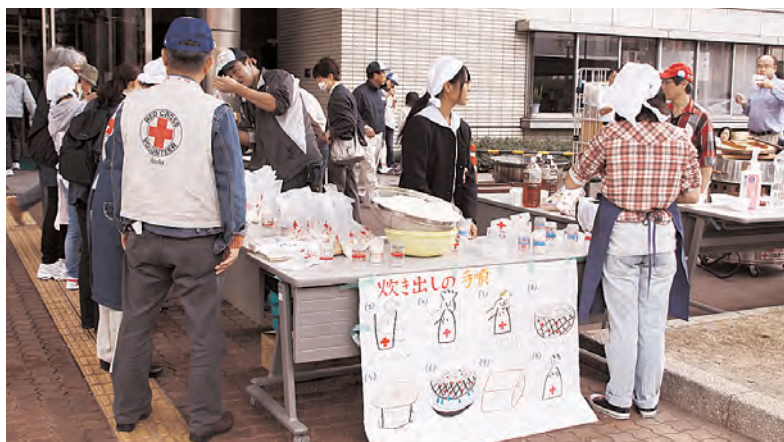
メンバーが炊き出しの手順を説明するコーナーも設けられました様子でした。

炊き出しの豚汁とおにぎりの提供、赤十字クイズラリー、大震災の際の活動紹介など多彩な催しの中で特に参加者の人気を集めたのは、「日赤愛知たんけん隊」。日ごろは目にする事のない災害備蓄倉庫を見学する企画です。地下のひんやりした備蓄倉庫に高く積み上げられた大量の救援物資を見て、参加者は「赤十字はこんな活動をしているんだ」「災害備蓄倉庫はすごい!」と驚い