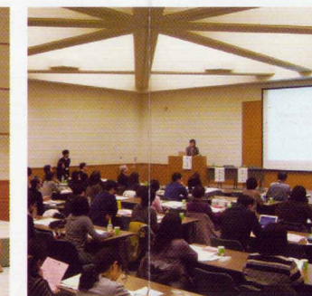
こどもサポーター研修