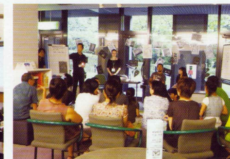
交流コーナーイベント