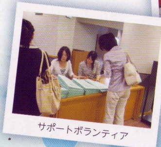
サポートボランティア