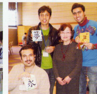
ひなまつり交流会