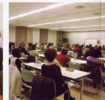
日本語ボランティア研修会