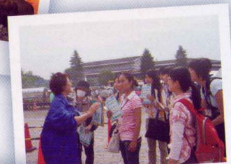
災害時言語ボランティア