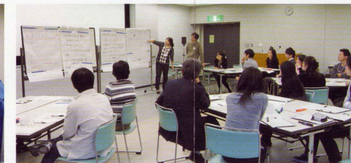
ファシリテーター養成講座