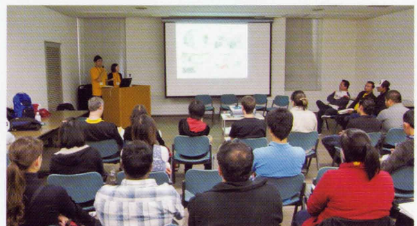
生活オリエンテーション