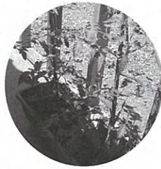
▲トマト作り トマト作り と、入居した 方が話してく れました。

日辺仮設住宅は、六郷地区の町内会毎に入居希望者をまとめ、申し込みをしたこともあり、窓の向こうにご近所の顔の見える生活となっています。さらには、これからに向けて、縁台を作る、玄関にブロックで階段を作る、プランターにナス、トマトを植えるなど、自分たちなりの工夫がなされています。洗濯物干し場の安全のための手作りの縁台は、お茶飲み場にもなっています。四か月前の避難所生活の後とあって、「汗をかいたとき、自由にシャワーを浴びられ、ホットする」と話してくれました。