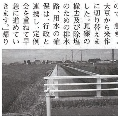
▲雨水幹線 左側が大豆から米作へ

日辺仮設住宅は、六郷地区の町内会毎に入居希望者をまとめ、申し込みをしたこともあり、窓の向こうにご近所の顔の見える生活となっています。さらには、これからに向けて、縁台を作る、玄関にブロックで階段を作る、プランターにナス、トマトを植えるなど、自分たちなりの工夫がなされています。洗濯物干し場の安全のための手作りの縁台は、お茶飲み場にもなっています。四か月前の避難所生活の後とあって、「汗をかいたとき、自由にシャワーを浴びられ、ホットする」と話してくれました。