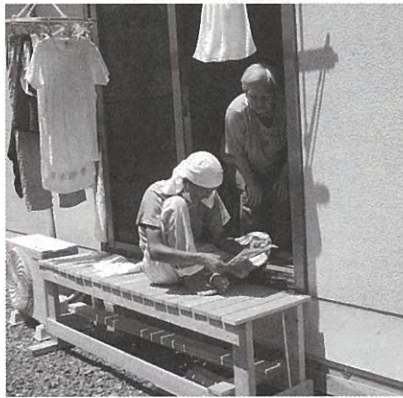
▲仮設住宅 手作り縁台で一休み