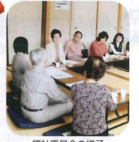
福祉委員会の様子

「福祉委員」という方々が、各町内会より推薦されて2~3町内会ごとにコーディネーターのもとに活動をしています。具体的な活動は、次のようなものです。 ○安否確認活動.....近隣住民による一人暮らし高齢者の見守り、「孤独死」「孤立死」の防止に努めています。 ○日常生活支援活動...日常生活の困りごと、例えば、ごみ出しの手伝い、庭の草取り、除草、外出の付き添い等を行っています。 ○サロン活動.....身近なところに集まって、気軽に交流し、「仲間づくり」「地域交流」「閉じこもりの防止」を進めています。具体的には「ふれあいサロン」「健康教室」「子育てサロン」があります。