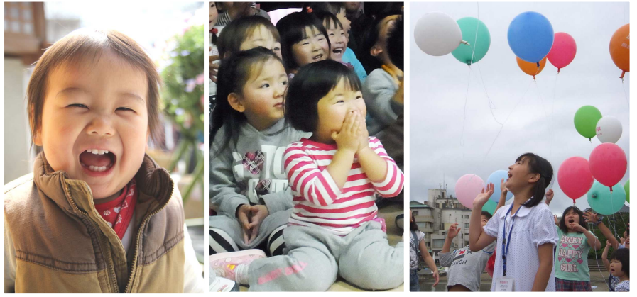
子供たちの笑顔は明日への希望だ

あの日からはや一年。 私たちは、たくさんの大切なものを失った。 しかし、深い悲しみの中から、 忘れかけていた大切なものがよみがえった。 日本人として生きる誇り ほこ と家族の絆 きずな 、 そして、明日を信じる勇氣と力一。 いま、復興に向けて私たちは立ち上がる。 あまたの御霊 みたま へ鎮魂 ちんこん の祈り ささ を捧げて……。