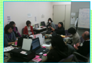
被災地状況報告（東北地方太平洋沖地震多言語支援センターにて）

2011年3月11日発災当初から、「東北地方太平洋地震多言語支援センター」では、災害情報をはじめ、避難生活から復興に向けて、さまざまな情報を多言語に翻訳して、発信しました。また、多言語ホットラインによる電話相談では、きめ細やかな対応を行いました。被災地と全国各地とを結び、支援活動を展開しました。