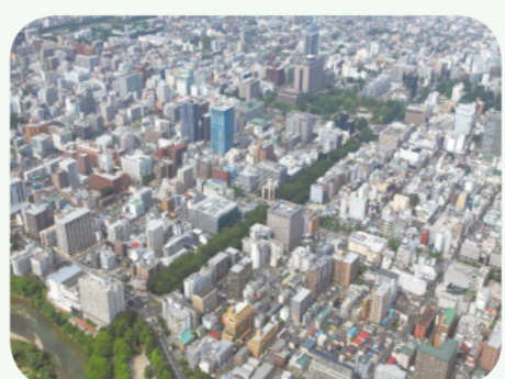
雇用の本格的な回復を図るため、特区制度を活用した雇用創出策を

問 厳しい雇用情勢の中で、復興特区を活用した企業誘致など新たな雇用創出策を検討せよ。 答 1T特区なども活用し、地域の中小企業などを対象に、安定雇用を誘導するための制度を適用するなど、企業立地および事業の拡大を促進している。さらに、企業が求める人材を育成するための