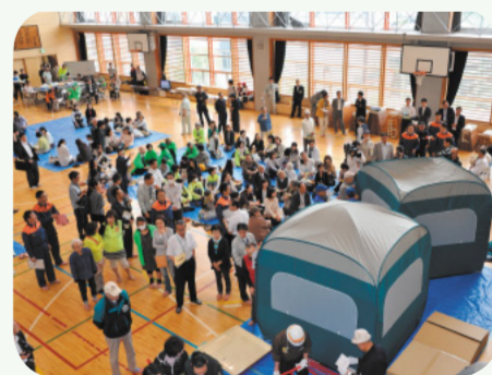
東日本大震災を踏まえた避難所運営訓練 (6月12日仙台市総合防災訓練)

問 大規模災害に対しては「公助」「自助」だけでは限界がある。まず、地域防災の基礎となる「自助」が重要であり、自助力の必要性が、しっかりと根付くよう取り組むべきと考えられているか。 答 災害時には、自らの命は自らを守るという意識を持ち、飲料水や食料を備蓄する等の「自助」