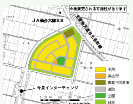
六郷地区の防災集団移転先の計画図

問 復旧は進んでいるが、復興への取り組みは弱い。復興事業特に県道塩釜百理線等の進捗状況と今後のスケジュールを伺う。 答 各種都市インフラの復旧やがれき撤去等はおおむね順調に進んでいる一方、復興事業については財源が確保できたため、今年度後半に具体の工事に着手できる状況になった。県道のかさ上げ工事については、今年度は基本設計、測量、調査を行う予定である。来