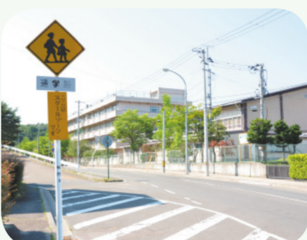
通学路の安全対策を早急に行うべき

問 全国で登下校時の交通事故が相次いでいる。急ぎ通学路を点検し、関係部局で連携し問題を整理して適切に対処すべきではないか。所見を伺う。 答 保護者や地域の協力のもと通学路の安全点検を行い、警察等の関係機関に要望や相談を行ってきた。今後とも、関係機関と連携