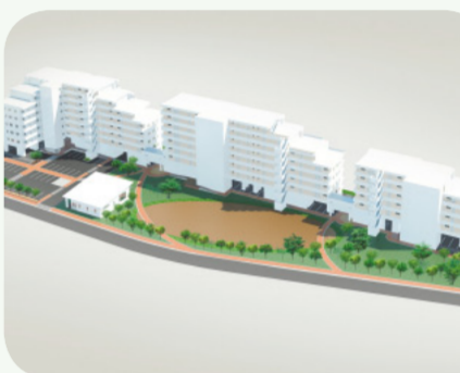
若林西復興公営住宅完成イメージ図

問 津波浸水区域の集団移転対象者で、復興公営住宅に入居する場合の支援措置は、引越費用は別だ。被災者生活再建支援金とは別に、国に制度創設を求めるところに、本市独自の支援も行つべき。 答 本市の復興公営住宅入居者は