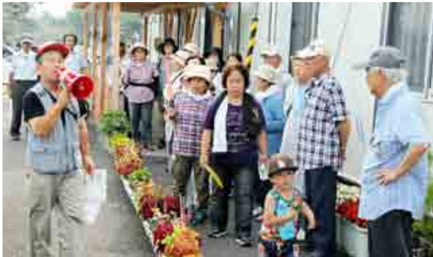
▲東矢本駅を目指して避難を開始する矢本運動公園仮設住宅の住民 (7月29日)