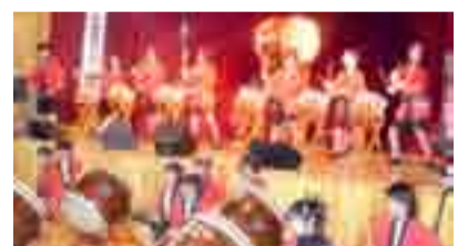
▲2011年 オール赤井まつりの様子