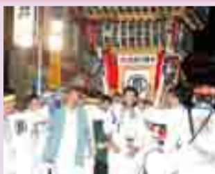
▲2010年東松島夏まつりの様子