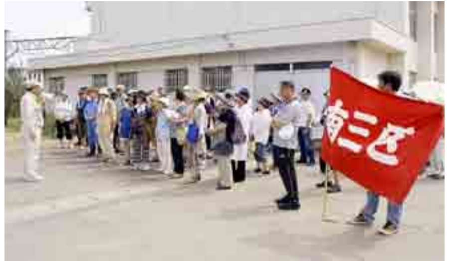
▲矢本第二中学校に避難する地区住民 (7月29日)

7月29日(日)、平成24年度東松島市総合防災訓練が実施されました。午前9時の訓練放送とともに津波の浸水が想定される地区の多くの市民が避難を開始。避難場所と避難コースの確認とともに防災意識を高めました。