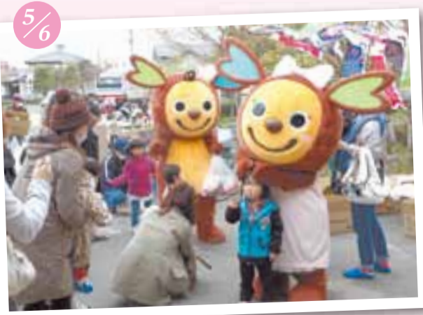
▲イト&イーナもたくさんお友だちと遊んだよ