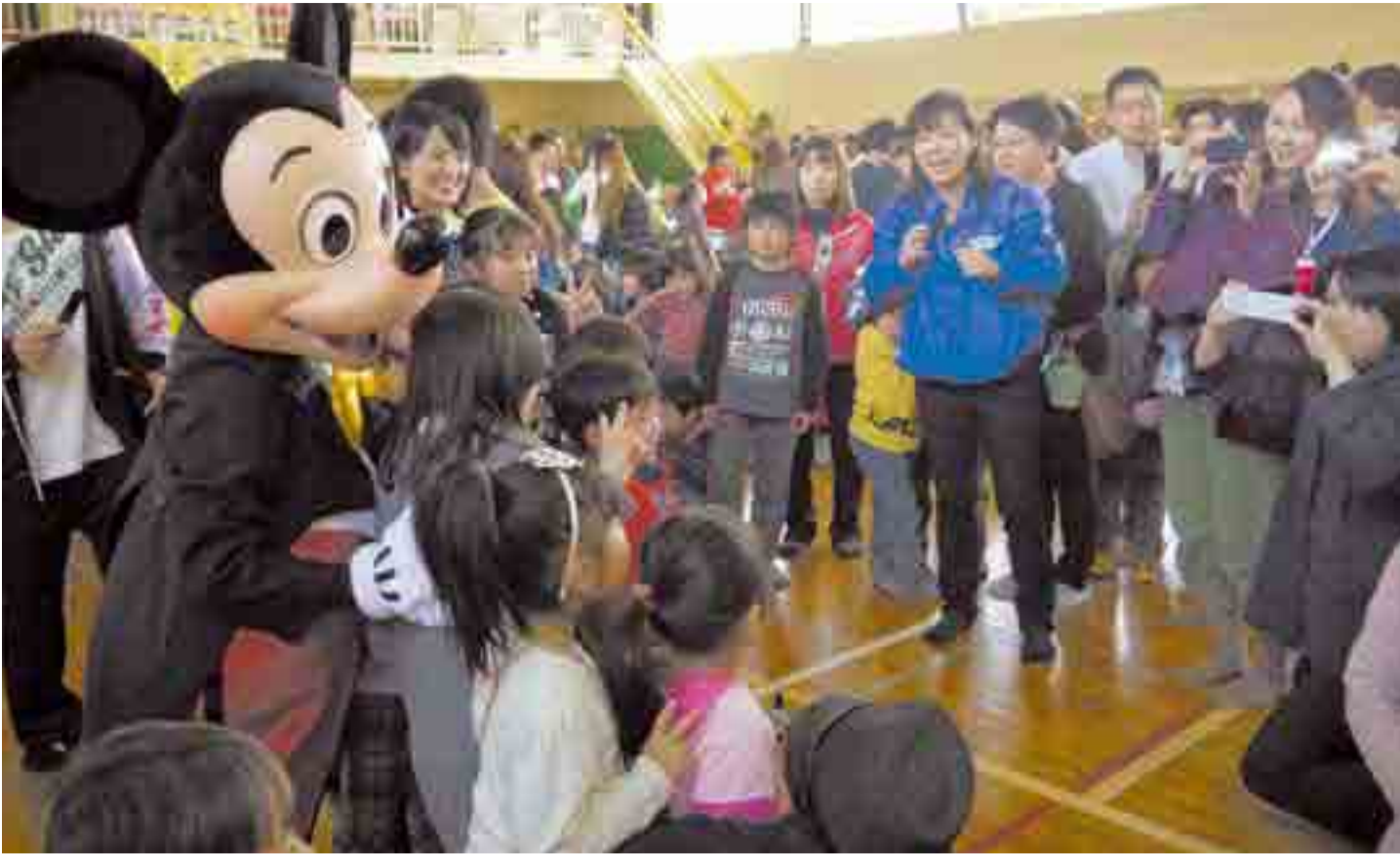
東 京ディズニーリゾートのミッキーマウスたちが小野小学校を訪問し、地域の子もたちと交流しました。人気キャラクターの登場に、集まった市民は大興奮。一緒に写真を撮るなどして楽しい時間を過ごしました(4月24日)