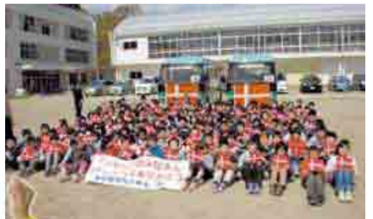
デ ンマークからの支援金で運行するスクールバスの前で児童が感謝の気持ちを表しました(5月2日、小野小学校)