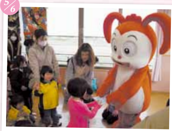
▼ランドセルの妖精「コラシヨ」(桃ベネッセ)が遊びに来ました