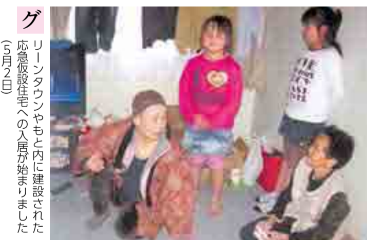
グ リーンタウンやもと内に建設された応急仮設住宅への入居が始まりました(5月2日)