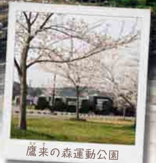
鷹来の森運動公園