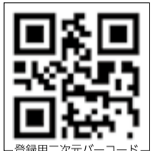
登録用二次元バーコード