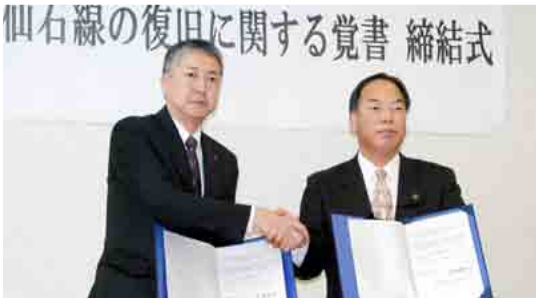
▲東松島市とJR東日本(写真左: JR東日本 里見雅行仙台支社長)は、震災により不通となっているJR仙石線陸前大塚一陸前小野駅間の早期復旧に関する覚書を締結しました(4月23日、市役所)