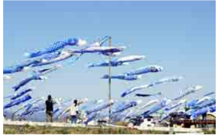
▲全国から寄せられた約360匹の青いこいのぼりが掲げられました

5月5日(土)、大曲浜地区で震災で犠牲になった子どもたちや地域の人たちを悼む集会が開かれました。青い鯉のぼりプロジェクトが主催し、当日は地域の人やボランティアらが集まり交流しました。