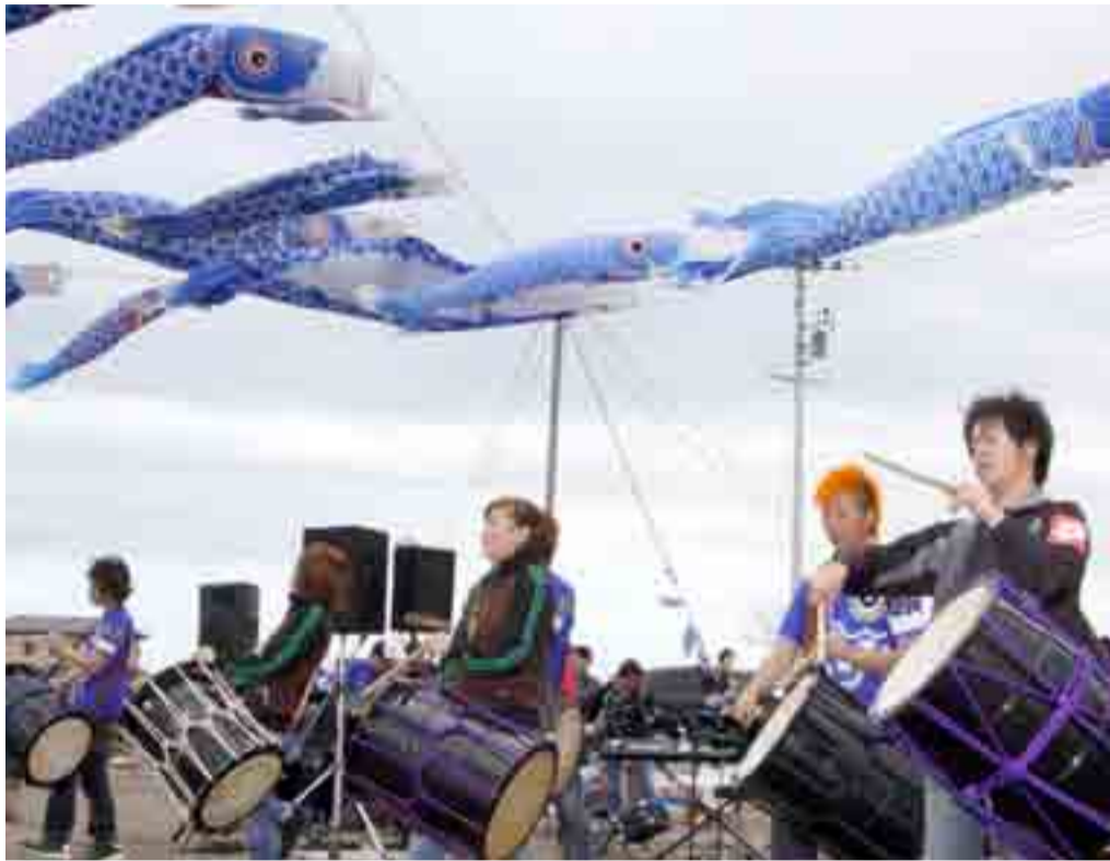
▲プロジェクトのメンバーによる犠牲者の霊を慰める鎮魂の太鼓が演奏されました(5月5日)