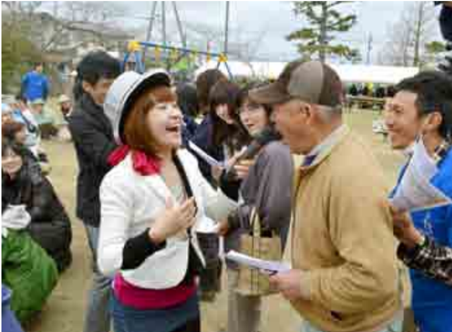
▲矢本運動公園仮設住宅自治会と支援30団体が企画した「ギネスに挑戦&お花見会」が、運動公園内の児童公園で開かれました。行われた2つのイベントのうち、輪唱で「かえるのうた」を歌う催しには参加者225人で記録達成。認定申請を行う予定です(4月21日)