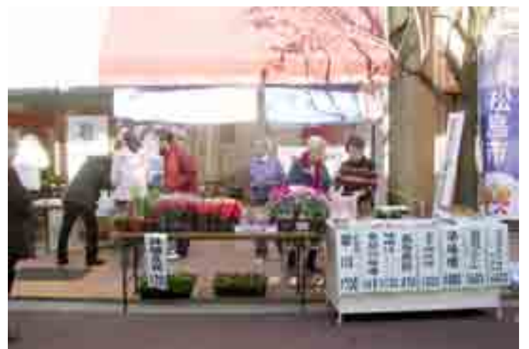
▲東京都大田区の久が原銀座商店街振興組合が主催の東松島物産展が行われました(12月10・11日)