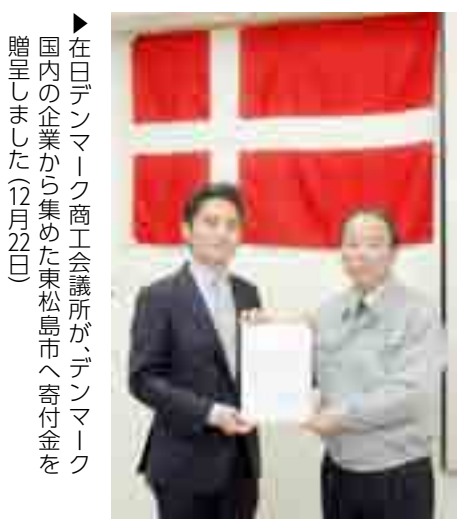
▶在日デンマーク商工会議所がデンマーク国内の企業から集めた東松島市へ寄付金を贈呈しました(12月22日)