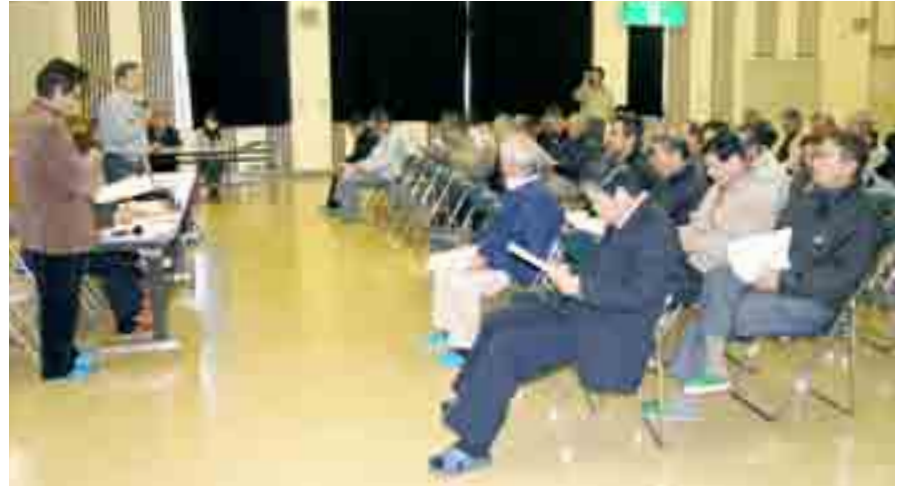
▲「鳴瀬地区小中学校復興への将来像を語る会」が開かれ、市民が参加して意見を出し合いました(12月18日、小野市民センター)

市教育委員会が示した将来像の検討素案を基に、新しい学校の建設場所や通学上の安全対策などについて、出席した市民から質問が出されていました。