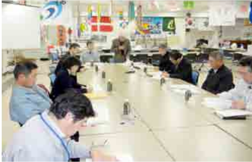
▲第1回市学校教育復興計画検討委員会が開かれ、鳴瀬地区の新しい学校づくりに ついて意見が交わされました(12月3日、市役所)

被災した鳴瀬地区の小中学校の将来像と教育のあり方を議論する市学校教育復興計画検討委員会の第1回会議が12月3日(土)、市役所で開かれました。検討委員会は学識経験者ら8人で構成され、本年度中