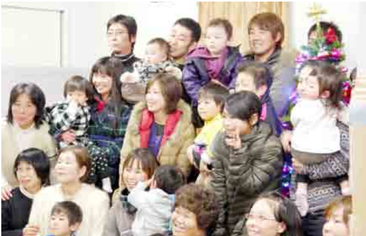
▲メジャーリーグのボストン・レッドソックス所属の松坂大輔投手が鳴瀬地区保育所を訪れ、サイン入りユニホームやTシャツを贈るなど子どもたちと交流を深めました(12月17日)

◀獅子頭に頭を噛んでもらって、今年1年の健康と復興への力を授かりました(大曲浜新橋 矢本商店街)