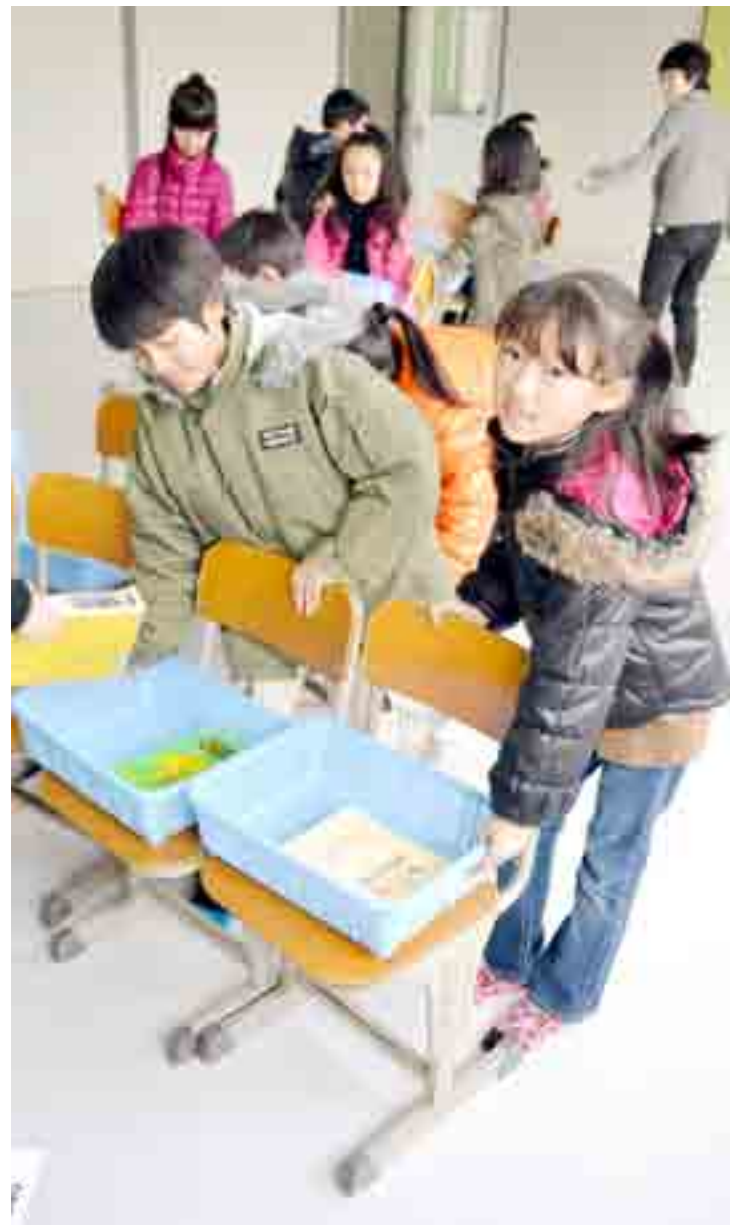
▲震災後、鳴瀬保健相談センター(鳴瀬庁舎内)に間借りしていた野蒜小学校の仮設校舎がケアハウスはまなすの里敷地内(小野)に完成し、2学期終業式が催された12月22日、全校を挙げて引越し作業を行いました。仮設校舎での授業は今年5日から始まっています