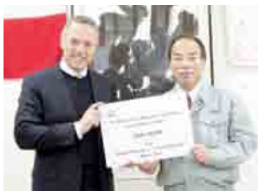
▲デンマークのマルグレーテ2世女王は、「東松島市デンマーク友好子ども基金」へ充ててほしいと50万デンマーククローネ(約720万円)を寄付しました。カーステン・ダムスゴー駐日大使が市に目録を贈呈しました(12月14日)