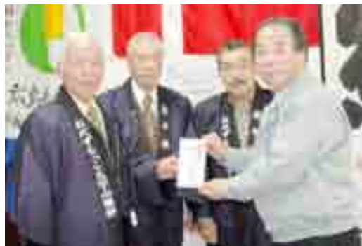
▼炭々倶楽部・おだずもっこ大学山楽耕が、市へ義援金を贈呈しました(12月20日)