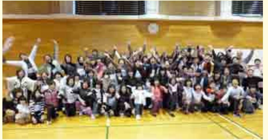
▲本番に向けて出演者たちの思いも一つに