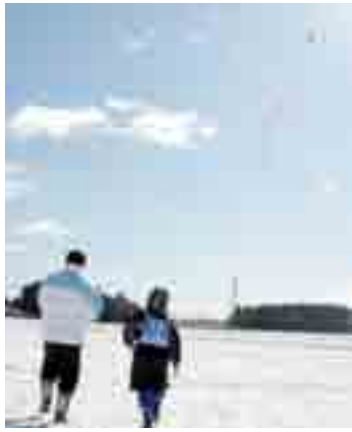
▲昨年のオール赤井あげ大会(2月6日)