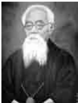
▲東北民謡の父 後藤桃水翁