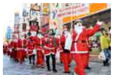
▲昨年、埼玉県所沢市で開催されたサンタを探せ!の様子