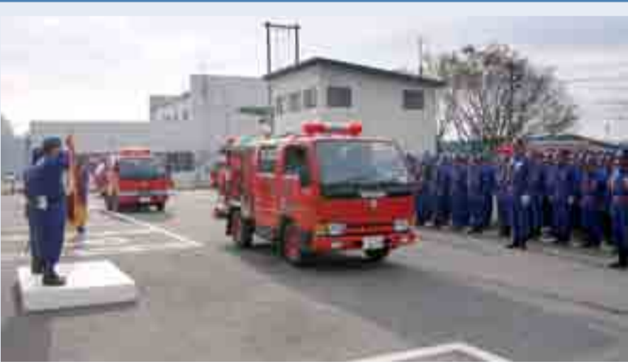
▲秋の火災予防運動出発式で、消防車両の行進が行われました(11月13日、市役所鳴瀬庁舎駐車場)