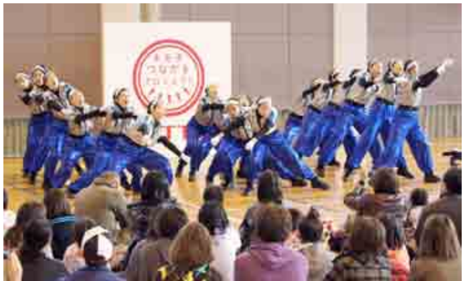
▲DANCE STADIUM in 宮城が開催され、2011年度全国ダンス部選手権大会優勝校の同志社香里高校ダンス部がパフォーマンスを披露しました(11月13日、小野地区体育館)