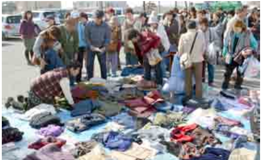
▲大曲地区の住民が久しぶりに顔を合わせ、将来を語り合おうと「地区民の集い」が開かれ、復興計画にかかるフォーラムや出店、プレゼント抽選会などが催され、にぎわいました(11月12日、大曲市民センター)