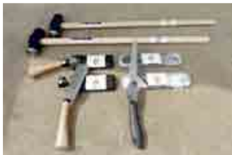
▶今回購入した安全対策用備品

■助成額 250万円 ■助成内容 鉄板焼器、やきとり焼器、かき氷機、ポップコーン機、屋外放送設備、テーブルベンチセット、厨房用品ほか安全対策備品など