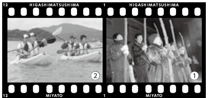
① 唱えごとを言って各家を回る月浜の子どもたち（平成23年1月撮影） ② 奥松島体験ネットワークでは宮戸の自然を堪能できる体験が大人気