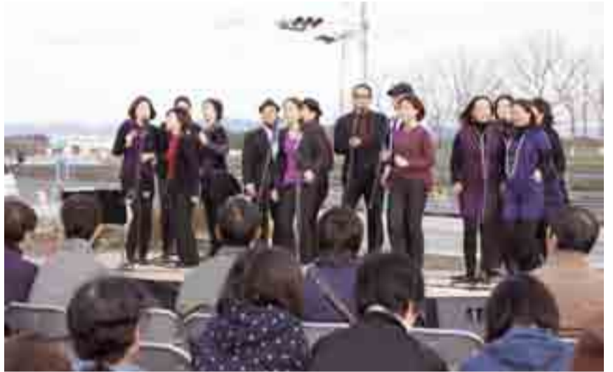
▲ゴスペルコンサートが開かれ、ゲストで訪れた神戸市のゴスペルグループ「リジョイス・ゴスペル・クワイア」が、代表的なゴスペルの歌の数々を披露しました(11月13日、赤井字新川前)