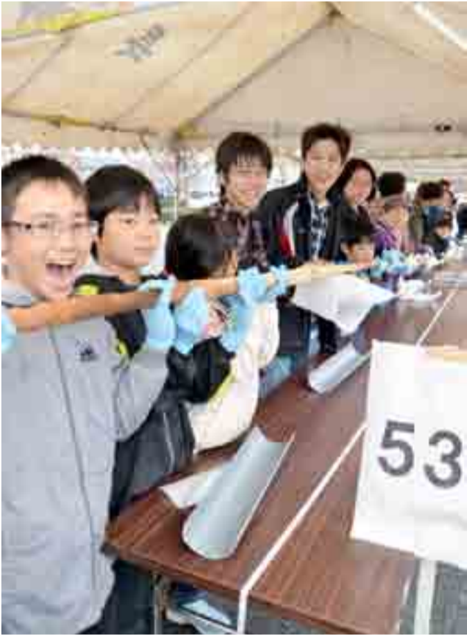
▲みんなで力をあわせて世界一なが〜い焼き麩が完成しました