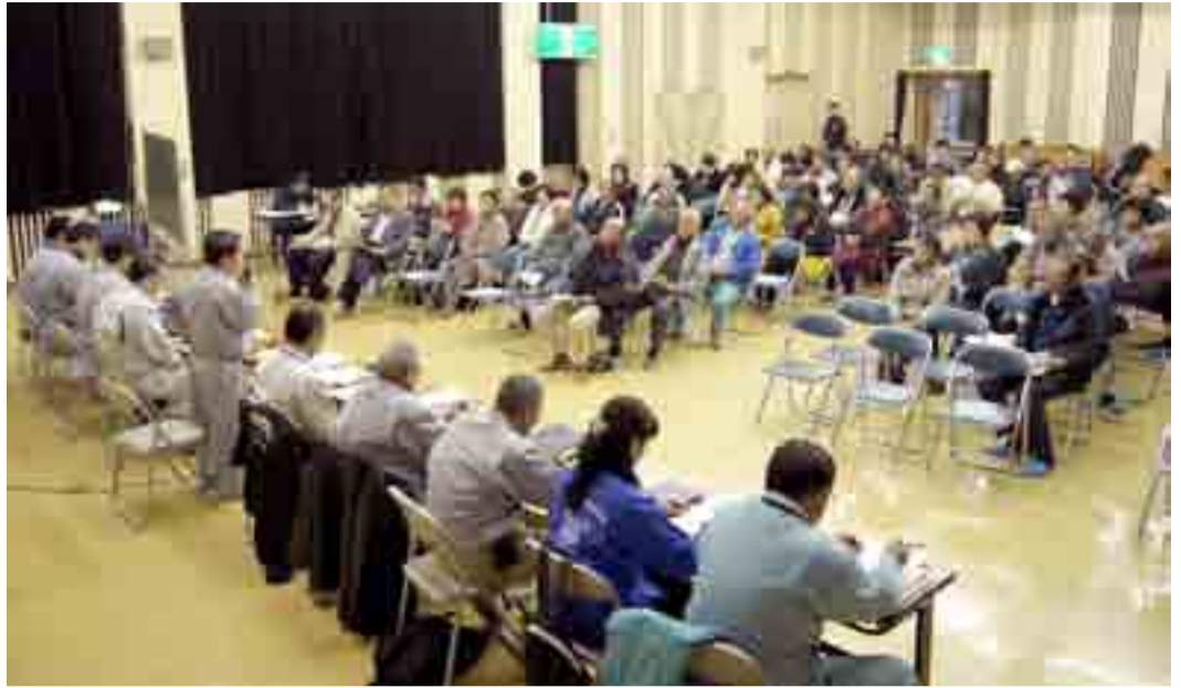
▲市は津波で大きな被害を受けた行政区ごとに、集団移転等に関する説明会を開催。浜市地区については、陸前小野駅南側に集団移転する案が示されました(11月9日、小野市民センター)