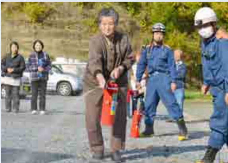
▶秋の火災予防運動にあわせ、矢本消防署が市内7カ所の仮設住宅で消防訓練を実施。寒さが厳しくなる冬場を前に、火災予防の心がまえを確認していました(11月15日、根古地区センター仮設住宅)