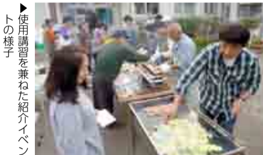
▶使用講習を兼ねた紹介イベントの様子

この事業は、宝くじの社会貢献事業として、コミュニティ活動の促進を図るために必要な備品などが助成されるものです。