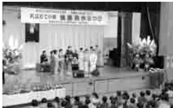
▲参加者と観客が民謡でひとつになった後藤桃水まつりの様子(昨年10月30・31日)