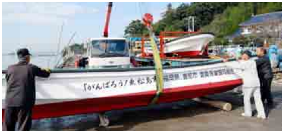
▲福岡県豊前市と豊築漁業協同組合から船外機船2隻が、県漁協鳴瀬支所に贈られました（10月28日、東名漁港）