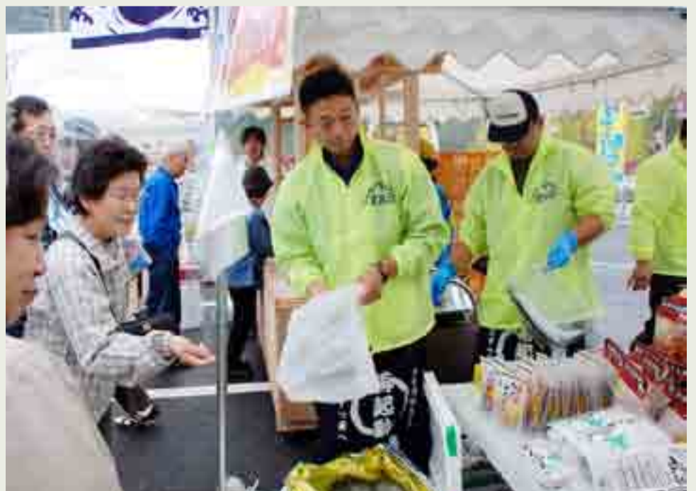
▲山形県東根市で、JAさくらんぼひがしね主催の「ファーマーズマーケットよってけポポラ・オープン8周年祭り」が開催され、震災復興応援として東松島市などの特産品販売が行われました(10月22・23日)