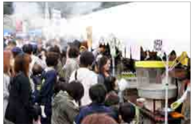
▲露店も数多く並び、大勢の市民が食事を楽しみながら話に花を咲かせていました(10月30日、野蒜小学校校庭)

野蒜まちづくり協議会主催の野蒜復興祭が10月30日(日)、野蒜小学校校庭を会場に開かれました。 地域の絆を大切に力を合わせて、ともにまちづくりを進めていこうと、会場では多くの露店が食べ物を提供し、衣料など全国から送られた救援物資の配布も行われました。 特設のステージでは芸能ショーも催され、大勢の市民が楽しいひと時を過ごしました。