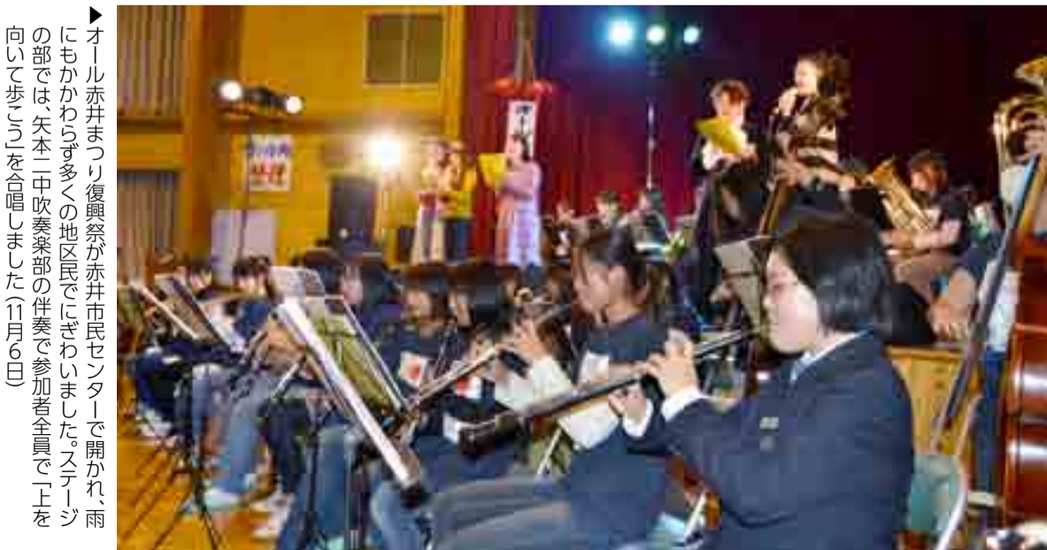
▶オール赤井まつり復興祭が赤井市民センターで開かれ、雨にもかかわらず多くの地区民でにぎわいました。ステージの部では、矢本一中吹奏楽部の伴奏で参加者全員で「上を向いて歩こう」を合唱しました（11月6日）