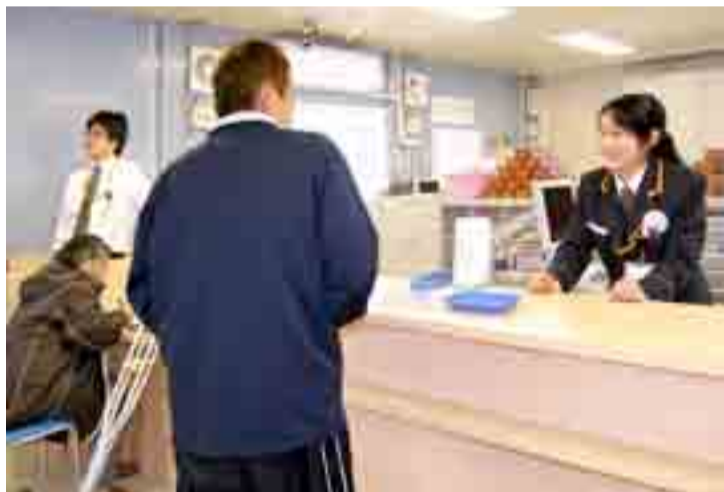
▲野蒜小学校校庭の一角を借りて、野蒜郵便局の仮設店舗が営業を再開しました（10月24日）