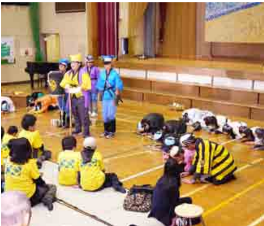
▲「宮戸小の秋祭り」では、全校劇「みゃとの黄門様」を発表。6年生4人が活躍しました(10月29日、宮戸小)