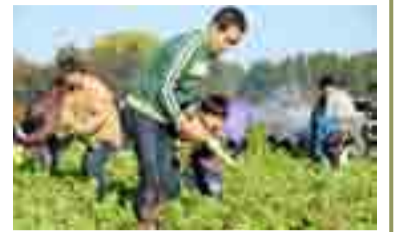
▲昨年の大根狩りの様子(11月21日)