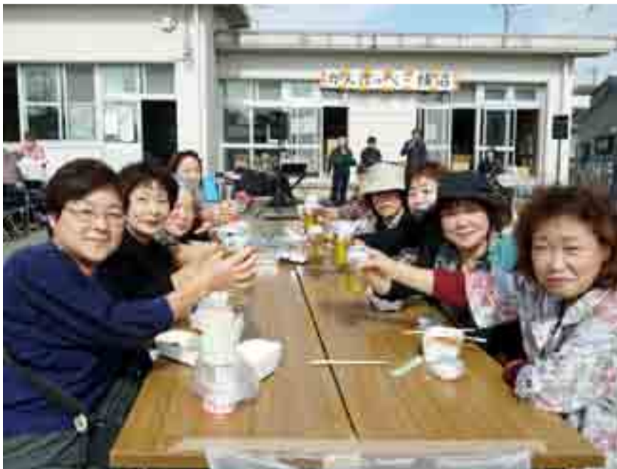
▲復興へ向けて地区民の交流を図る「がんばっぺー横沼」(横沼地区センター主催)が開かれ、多くの住民でにぎわいました(10月23日、横沼地区センター)

▶福岡県粕屋町で「YOSAKOIかすや祭り」が開催され、東松島市に支援業務で来た町職員有志(左から2・3・4人目)がイベント会場内で東松島の物産販売やステージでの復興PRを行いました(10月・0日)