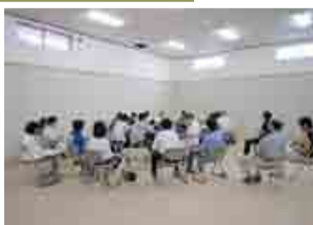
▲あったかいホールでのボランティア・支援団体によるミーティング

☎98-6061 FAX98-6062 E-Mail:attakai@ia9.itkeeper.ne.jp