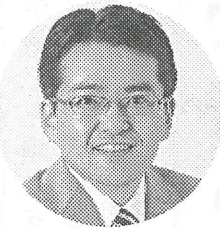
11月20日(日)、北海道後援会が札幌市中央区

民センターで2011年度の「総会」と「学習集会」を行います。10月11日に党中央委員会は、次期衆議院選挙の第