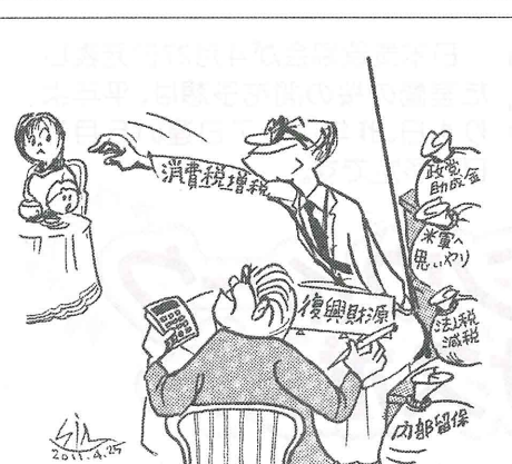
手を伸ばす... 一身近な財源には手をつけずに— ウルシ・ヒロ

いつせい地方選挙では、被災地の救援・復興、原子力行政とエネルギー政策の転換、福祉と防