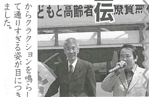
無償原稿者高年齢ともども

「国保料の引き下げや住宅リフォーム制度」などの公約実現に努めます。「市民のみならず」と引き続き力を合わせます」と呼びかけました。