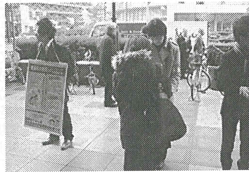
全労連の宣伝・署名

ところが物価下落といっても、消費者物価指数に反映されない社会保険料は上がり続けており、高齢者の家計は厳しくなるばかりです。新年度から、室蘭市の介護保険料は平均で1人年4万2000円から4万6000円と4000円上がる見込みです。75歳以上の後期高齢者医療の保険料も1人平均年間1600円上がります。