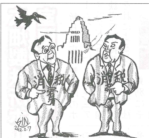
同じ模様 一民主と自民 増税に違いなし 倉田 新

萬世閣労組裁判は、2008年12月に従業員が萬世閣労組を結成し、26名が原告となって労働委員会や裁判でたたかい、今年1月に、中労委審判の会社と労組双方の解決文書整理を残し全て解決したもので、その内容は、原告の全員に解決金が支払われ、様々な不法行為に対し、「ホテル」側が謝罪すると言います。