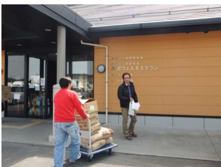
支援物資も福祉施設などに届けられています