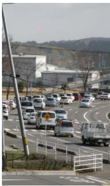
道路の渋滞が連日続く利府街道

県道仙台松島線には連日、渋滞の列ができ、営業を予定していない店舗の前にも車が待機している状態が続きました。中には車を給油所の前に乗り捨てる方も多く、モラルの低さも目立ちました。