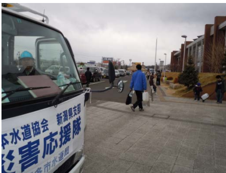
全国から届く、あたたかい支援