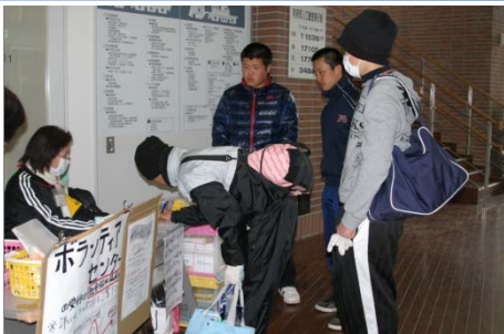
連日、高校生や中学生などのボランティアなども多く駆けつけてくれます

また、今後につきましては、予定していた事業も状況により、中止、延期される場合がありますので、ご了承ください。