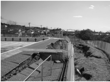
しらかし台小学校プール