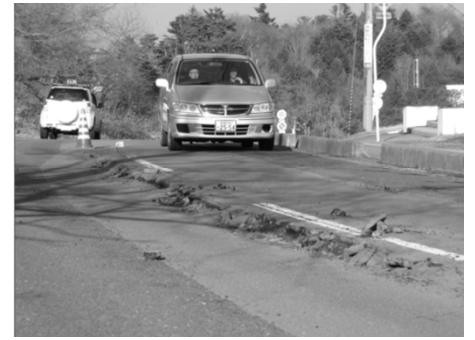
道路の亀裂（利府第三小学校前）