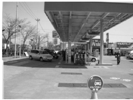
給油と物資を買い求める