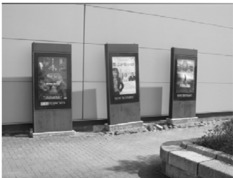
構造物にひび割れが相次ぐ

没など、これまでに経験したことのない大きな被害となりました。また、小売店やガソリンスタンドには、長蛇の列ができ、被災地での物資不足に拍車をかけました。中でも給水所には、連日、長時間の給水を待つ列ができました。