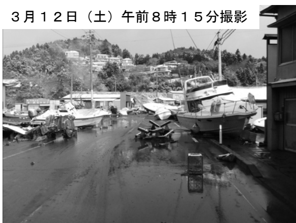
浜田・須賀地区は泥が堆積

町では即時に災害対策本部を設置し、被害状況の把握にあたりました。しかし、地震直後に天候が崩れ、交通渋滞と一時騒然としました。