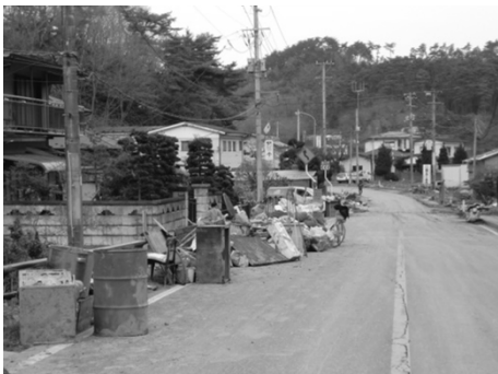
床上浸水により家具が水没