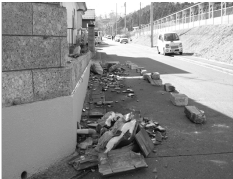
瓦屋根が道路に落下